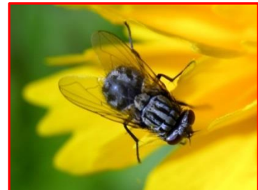
Stomoxys calcitrans (Muscides) Mouche des étables