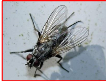
Fannia canicularis (Fanniides) Petite mouche domestique