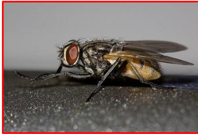
Musca domestica (Muscides) Mouche domestique

APPIFLY® cible la mouche domestique ( Musca domestica ), la petite mouche domestique ( Fannia canicularis ) et la mouche des étables ( Stomoxys calcitrans ), qui représentent 95% des espèces présentes en élevage.