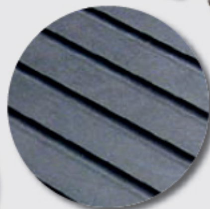
Face inférieure rainurée