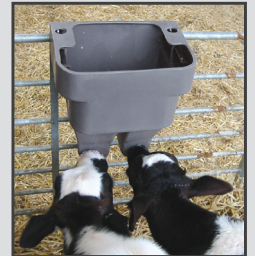
MB18 2 veaux