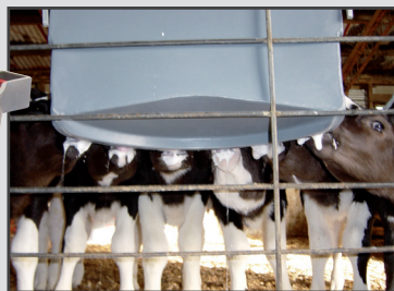
MB26 6 veaux