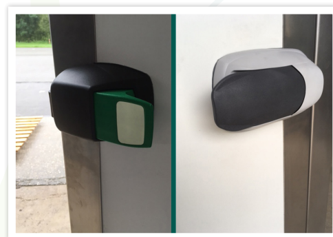
Verrou avec ouverture intérieure / extérieure